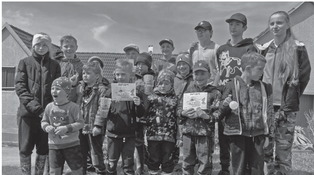
Rozzářené oči dětských účastníků a prosluněná obloha byla hlavní odměna pořadatelům závodu.

Průběžně se pekly špekáčky, smažily kapří kousky a vařila káva k výborné buchtě. Pivo bylo studené a polévka horká, vše tak, jak to má být. Všichni dětští