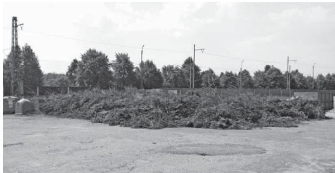
Tato živelná hromada větví se nekontrolovatelně nashromáždila během tří měsíců (tolik větví v naší obci snad ani nemáme...)

jak třídít jedlé tuky a oleje. Závěrou PET láhev postavte na nádobu s komunálním odpadem, papírem, plastem či bioodpadem ve svozový den. Nyní je tato služba doplněna i o sběr použitých baterií/monočláneků. Jednoduše je vložte do plastového sáčku a umístěte ve svozový den na zmíněné nádoby. Co se týká sběrných nádob na sklo, použitý textil a kovy, ty jsou zatím umístěny v jednotlivých částech obce. Připomenu, že samoobslužný režim před obecním úřadem bude přesunut do plošného areálu čistírny odpadních vod s jasně danou otevírací dobou. O zahájení provozu v tomto areálu budete informováni prostřednictvím SMS služby. mp