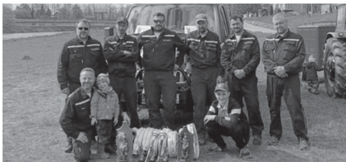
Šťastní výherci hodnotných cen na náplavce u Dlouhého mostu