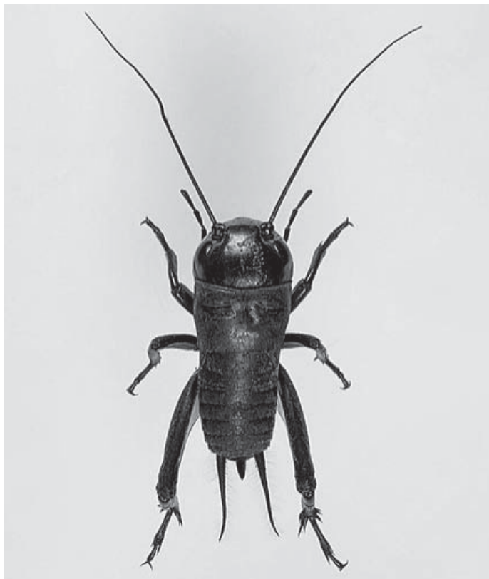
Skutečná velikost cvrčka je cca 2,5 cm.

Ale kdypak jste naposled slyšeli ladit housličky cvrčka? Ten se ozývá většinou až později odpoledne a v noci a jeho cvrkání je sled velmi jasně znějících „cvrk“, které následují neustále jedno za druhým, celé hodiny. Pokud byste se ho snažili vystopovat, zjistíte, že koncert pořádá v ústí své nory, což je otvor v zemi o průměru zhruba 2 centimetry, který si sám vyhrabe. Musíte se