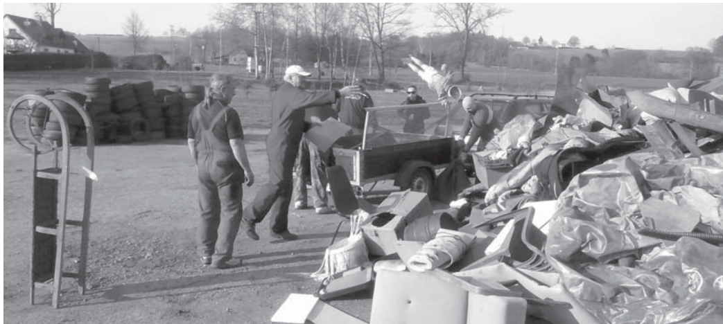
Celkem bylo odvezeno 13144 kg velkoobjemového a nebezpečného odpadu včetně 31 ks elektrospotřebičů. Obec zaplatila za odvoz 31.628,- Kč.