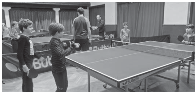
Střeďeční skupina dětí v plném tréninku pod dohledem trenéra a zástupce rodičů.