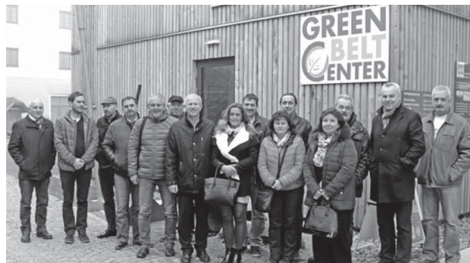
Starostové ze SMO Pomalší před budovou komunitního centra ve Windhaagu.

Jsem vždy velmi mile překvapen, když zastupitelstvo obce schválí nějaký zásadní stavební záměr a sotva se tento zápis objeví na úřední desce, již se ptají někteří občané na podrobnosti. To je známka, že se čte. Jeden takový záměr je výstavba sběrného dvora v prostoru ČOV. Rozumím jistěmu zděšení obyvatel bydlících přímo v dané lokalitě, vše se proto pokusím vysvětlit. Záměrem není vybudovat v tomto místě nějakou skládku, ale oplocený a uzamčený prostor, který bude kolem dokola osázen zelení. Uvnitř stojící technická budova bude rozdělena na několik částí. Technická část se sociálním zařízením pro zaměstnance obce, část pro parkování komunální techniky a sklad.