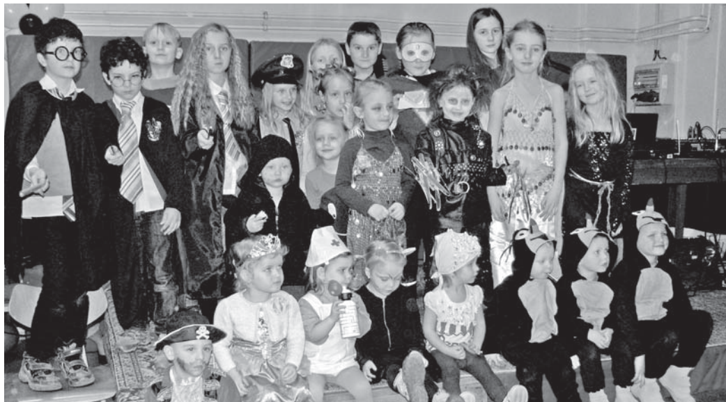
Na černobílé fotografii to není až tak patrné, ale v letošních maskách převládala barva černá. Stříhoruký Edward - v prostřední řadě třetí zprava.

Příjemnou neděli 26. 2. 2017, plnou soutěží, her, tancování, mlsání a cen, zažily děti v místní Sokolovně Nová Ves, kde se tradičně konal dětský maškarní rej, pořádaný spolkem TJ Sokol Nová Ves. Porota jednoznačně zvolila vítěznou masku Stříhorukého Edwarda, z kterého se na stupni vítězů vyklubala křehká dívenka Adéla