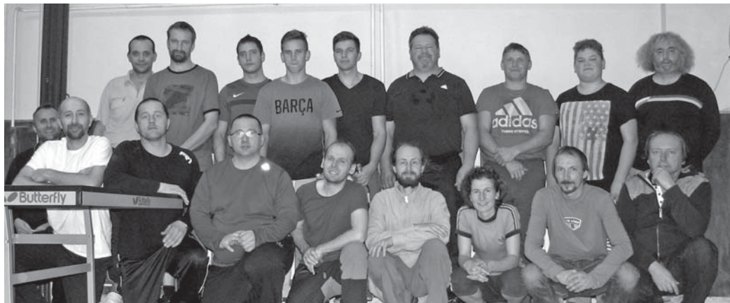
Fotografie dokumentuje hojnou účast, i přesto, že se akce vyjímá ukeřně ve všední den.