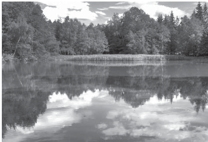
Klidná hladina Šanderáku při pohledu z hráze.