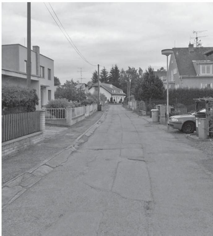
Stav ulice těsně před opravou.