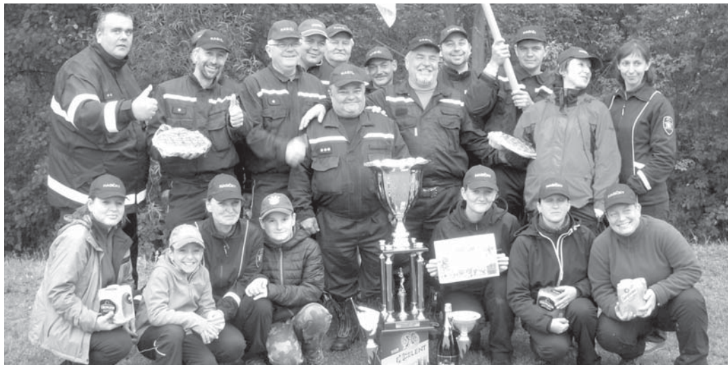
Členové SDH Nová Ves s cenami za 1. místo v soutěži o Pohár starostů v Nových Hodějovicích.

V pravidelném letním čase jsme se aktivně zapojili do spolupřátání Novoveských slavností. Zde jsme zajišťovali brannou hru pro děti i dospělé. Nechyběla pěná koupel a pomoc při názorné ukázce poskytnutí první pomoci za účasti profesionálů ze ZZS. Velkého úspěchu jsme dosáhli na soutěži O pohár starostů sousedních obcí, který se konal v Nových Hodějovicích. Zde