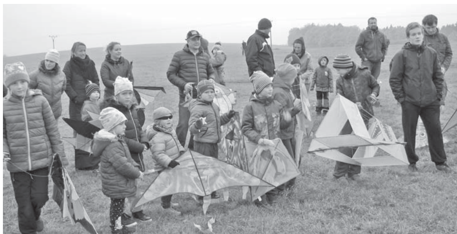
Malí drakovodi se svými draky a dospělým doprovodem.