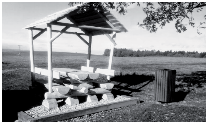
Nově osazený přístřešek na hůrecké vyhlídce.