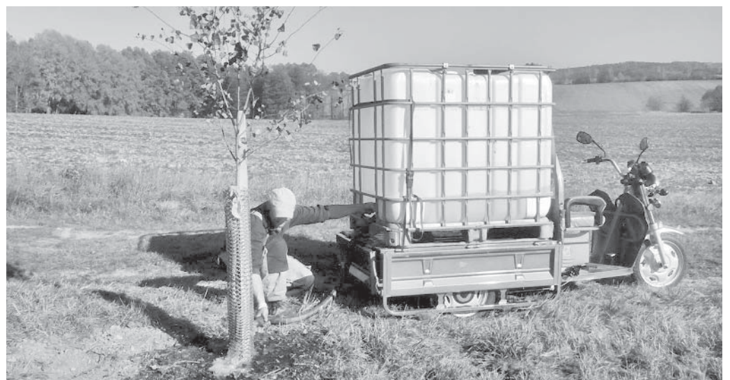
Elektrotříkolka se hned osvědčila i při závlivce osikového stromořadí směrem ke Chlumku.

O dotacích si myslím své. Na jedné straně neskutečně pokrývají přirozený trh, ale jak říkám, když už je máme, bylo by hloupé si na ně nesáhnout. Jednou z takových možností byla výzva na pořízení elektromobilu ze Státního fondu životního prostředí (SFŽP). Samozřejmě, že pořízení osobního automobilu pro potřeby obce by bylo příjemné, ale tento nákup není v současnosti naší prioritou. Jednou z hlavních je i zjednodušení a ulehčení práce při údržbě a provozu naší obce. Využili jsme této výzvy a prostřednictvím SMO Pomalší jsme pořídili pracovní elektrotříkolku, která se co do výkonu vyrovná malé dodávce. Zdůrazňuji, že v tomto směru jsme společně s Ločenicemi a Mokřým Lomem ze svazku Pomalší jakýmsi průkopníky v Jihočeském kraji. Pro ty,