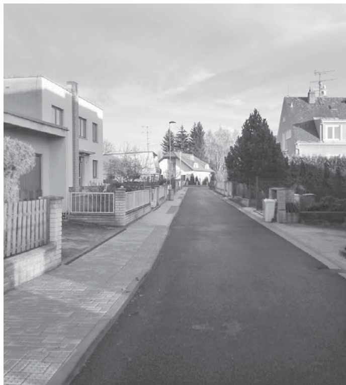
Současný stav. (Najdi 10 rozdílů).