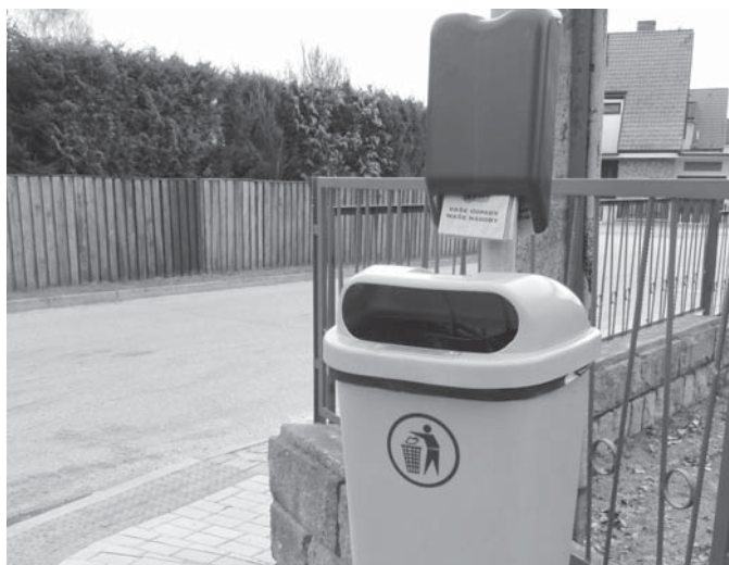
Jedno z mnoha míst určené pro použití sáčků na psí exkrementy.