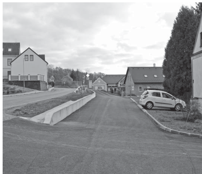
Současný stav místní komunikace po provedené opravě.