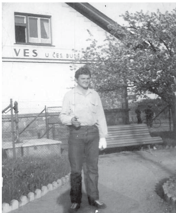
Prostranství na přelomu 60. – 70. let minulého století.

aby si přespolní zloděj zničil pilu a mladíci na Pionýrech (dnešní sedmdesátníci) tam u rozcestí měli, díky travnatému ostrůvku, první kruhový objezd na světě... První asfaltování v těchto místech asi nikdo písemně nezaznamenal.