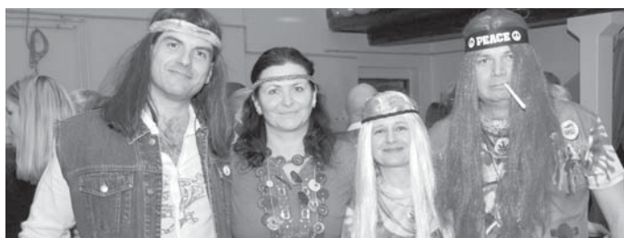
Někteří návštěvníci pojali svůj dress-code opravdu zodpovědně.

U plynul poslední únorový víkend a s ním i letošní Retroples, který se tentokrát nesl v duchu 70. – 80. let. Účast byla opět hojná a tímto bychom chtěli poděkovat všem, kteří zaplnili vyprodaný sál Sokolovny, za účast. Atmosféra byla skvělá. Barmanskou show doplnilo taneční vystoupení a potom už se mohla