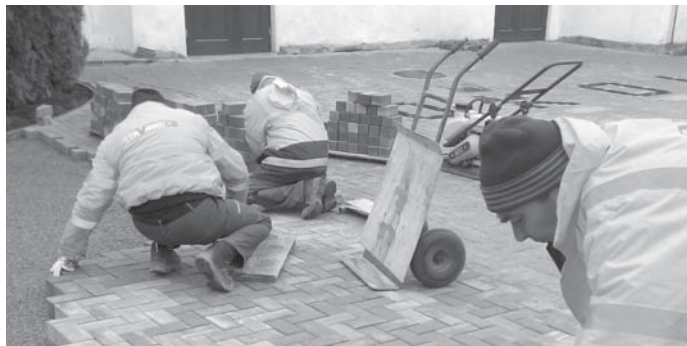
Zaměstnanci firmy Staving CB při pokládce zámkové dlažby před Sokolovnou.

Nová Ves ve výši 82 tis. a operativnímu přístupu stavební firmy Staving CB, jejíž zaměstnanci celou opravu provedli, je parkoviště hotovo. Podařilo se upravit kanálové vpusti, kryty hydrantu a vodovodního šoupeře, položit zámkovou dlažbu s nápisem SOKOL a osadit rohože před vchodové dveře. Celý dojem ještě umocňuje nový odpadkový koš určený hlavně kuřákům. Konečná cena této akce mírně přesáhla 200 tis. Kč jh