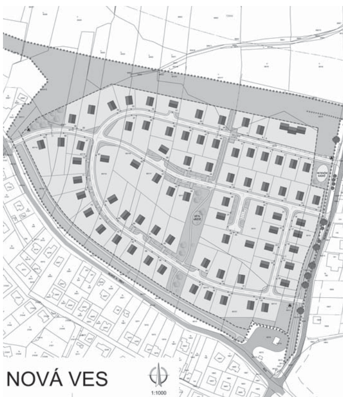
Územní studie 2, ve které je vyřešen prostor na louce nad benzinovou pumpou.