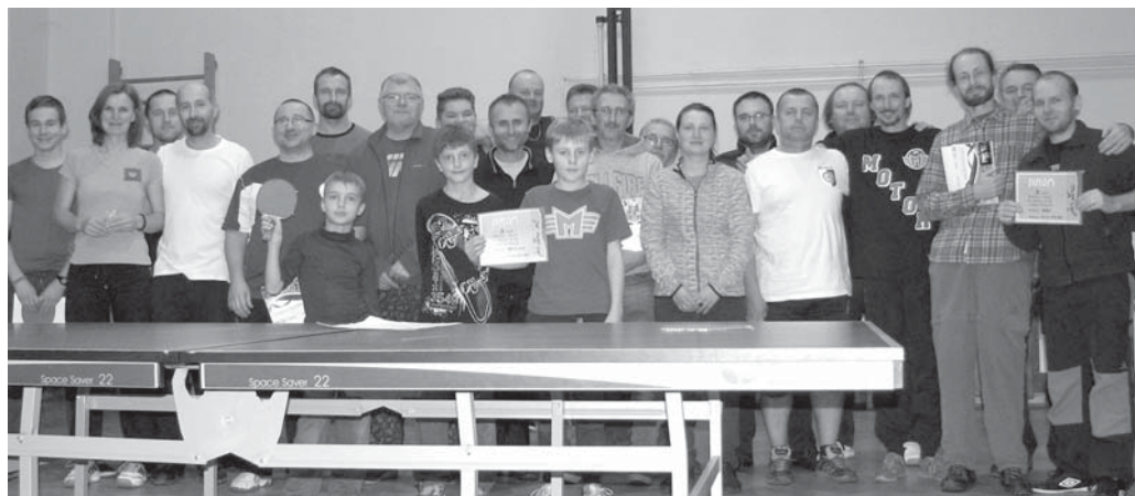
Účastníci turnaje po jeho závěrečném vyhodnocení.