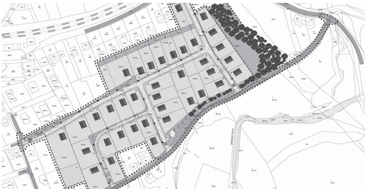
Územní studie 5 zpracovává rozmístění budov a infrastruktury na louce pod cukrárnou (nad cestou od ČOV k hlavní silnici).

se velmi těžko hledá řešení, které by uspokojilo všechny. Do 13. března mohou tito majitelé podat poslední připomínky nebo je konzultovat s projekční kanceláří. Návrh celé studie je zveřejněn na webových stránkách obce. mp