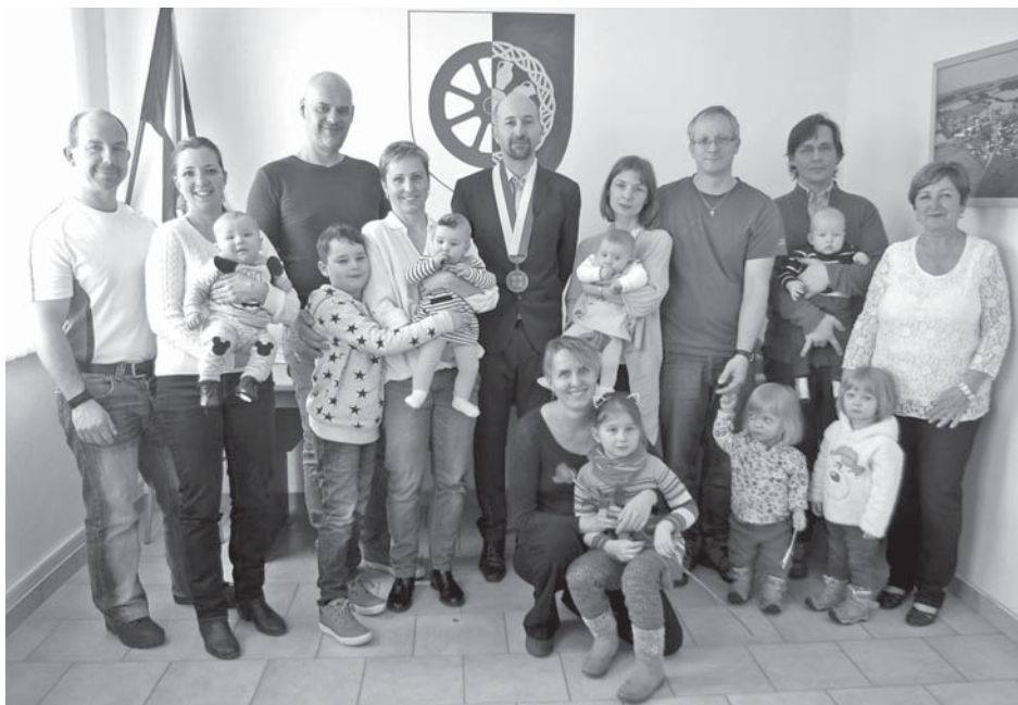
Při letošním vítání občánků jsme se pohodlně vešli jak do zasedací místnosti tak i do objektivu.