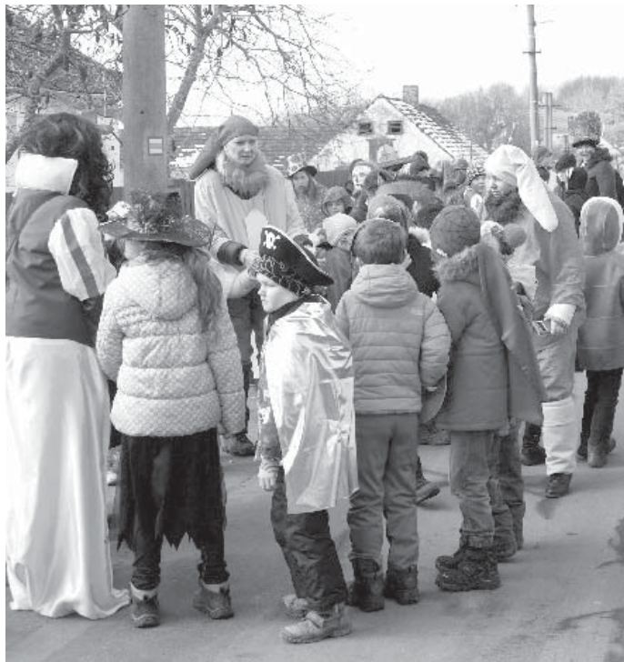
Masopustní průvod žáků a učitelka zaplnil ulice obce Nedabyle.

Na masopustní úterý navštívili školu kejklíři a děti se naučily