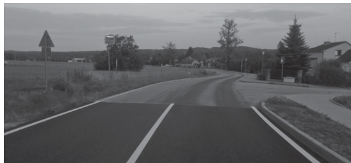
Předěl mezi opravenou a neopravenou částí komunikace směrem od Nedabyle.