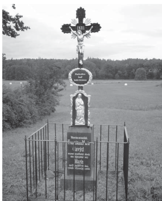
Takto vypadá pomníček dnes po důkladné opravě.