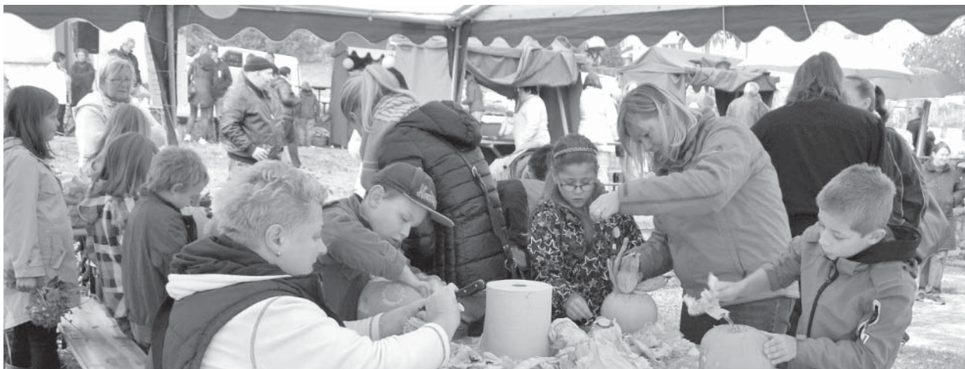
Před rokem panoval ve stanu opravdový tvůrčí elán.