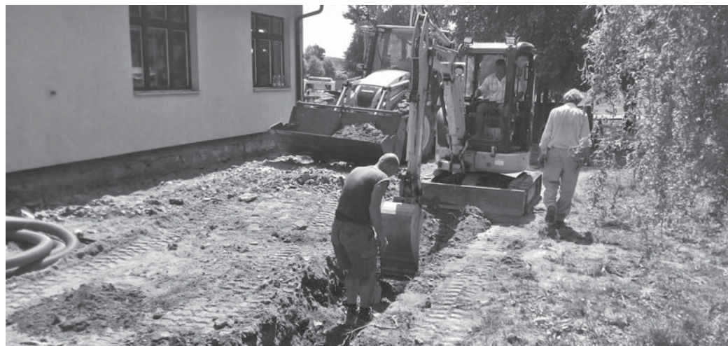
Dělníci a stavební stroje při kopání základu.