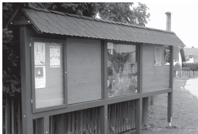
Nová nástěnka „u myslivny“

Všechny informační nástěnky v obci procházejí kompletní výměnou. Vede nás snaha ujednotit jejich celkový vzhled, a co je nejdůležitější, zapracovat do nich naprostou novinku a tou je informační mapa čísel popisných. Jak jistě všichni víte, katastr obce Nová Ves obsahuje dvě části, a to Hůrku a Novou Ves. Dále velmi těsně sousedí s katastrem obcí Nedabyle a Borovnice. Proto u nás dochází k naprostým paradoxům, jako je třeba to, že ulice uprostřed obce je na jedné straně Hůrka, přes ulici Nová Ves a na konci Nedabyle. Je naprosto běžné, že pošta, určená adresátovi na Hůrce, skončila jinému v Nové Vsi se stejným číslem popisným. Nově osazované