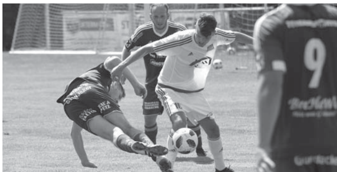
Bojovalo se o každý míč.

Již tradičně jsme zajišťovali občerstvení pro návštěvníky Novoveských slavností. Opět se peklo prasátko, domácí bramboráky a dětem jsme připravovali pikadory. V horkém letním počasí teklo pivo proudem a sportovní areál ožil jako mraveniště. Za podporu děkujeme především Obci Nová Ves, Catering CB, Plzeňskému pivovaru a Generali pojišťovně. Letos byla využita všechna sportoviště TJ Nová Ves. Na fotbalovém hřišti se v rámci letní přípravy utkaly týmy TJ Nová Ves a USC Rappottenstein z Rakouska, i když utkání skončilo výhrou hostů 3:5, bylo se na co koukat a navíc