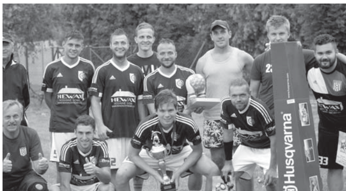
Domácí mužstvo po převzetí cen za vítězství v turnaji.