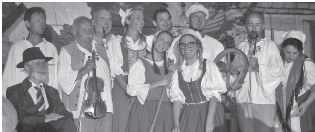
Členové divadelního spolku Utopenec při závěrečné „děkovačce“.