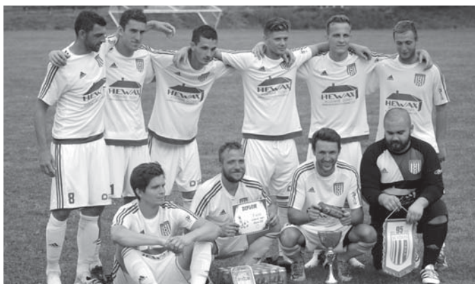
Vítězný tým po finále na Včelné.

V prvním zápase se náš tým utkal s TJ Sokol Kamenný Újezd B, porazili jsme jej 6-ti góly. Druhé utkání, tentokrát již finálové, jsme vyhráli 9:0 proti TJ Sokol Přídolí a stali se vítězi celého turnaje. Obhájili jsme tak prvenství z loňského roku.