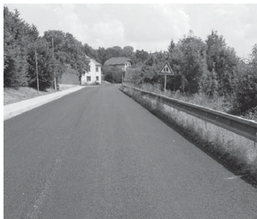
Pohled na opravenou silnici směr Trhové Sviny a vpravo směr České Budějovice

Kdo jste se prošel po silnici v době uzavírky, určitě pochopíte, co mám na mysli. Takový klid jsme v Nedabyli dlouho nezažili! A dovlím si tvrdit, že vzhledem k současnému vývoji dopravy, už nezažijeme. Taková pohoda a bezpečný pocit při pohybu na návsi, při jízdě na kole nebo přecházení silnice! Vcelku bez problémů jsem