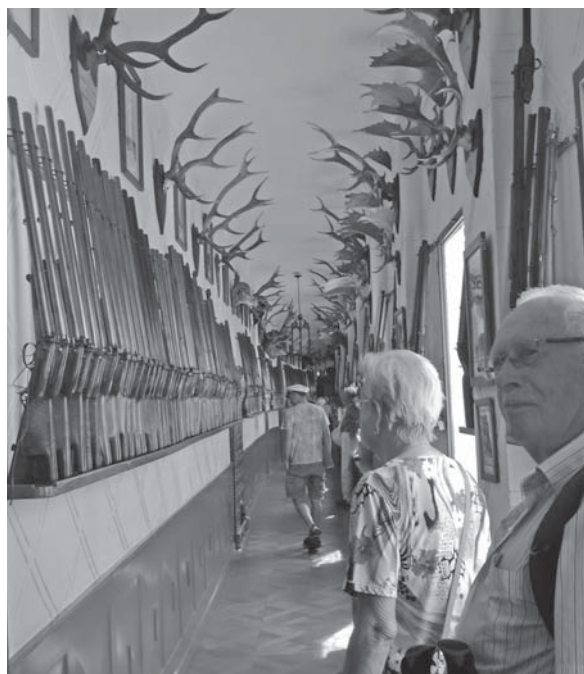
Naši senioři při prohlídce zámku Orlík.

Starosta se o lid starat musí, to je přece věc jistá. Náš starosta však liga je, je ten nejlepší ze zastupitelstva.