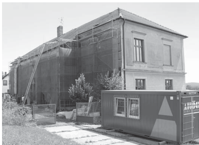
Severní stěna školní budovy zakrytá lešením.

Budova projde poměrně náročnou rekonstrukcí. Cílem rekonstrukce je rozšířit prostory pro školní výuku půdní vestavbou a částečnou nástavbou podkroví a zřídit mateřskou školu v uvolněných prostorech v přízemí. Stavební povolení pro tyto úpravy bylo vydáno již v roce 2012. Od té doby se obec Nedabyle snažila získat finanční prostředky. Ze samotného rozpočtu obce se tak velká akce nedá realizovat. V roce 2013 se