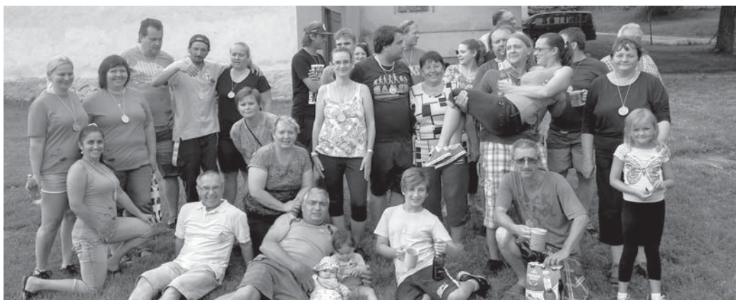
Ve čtvrtek 9. 8. 2018 proběhl 10. ročník turnaje „Ruských kuželek“. Tato akce se každoročně pořádá v prostoru u Bačovy stodoly. Letošního ročníku se zúčastnilo 7 čtyřčlenných družstev.