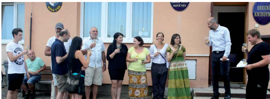
Srdečný přítpek místních umělců s panem starostou při slavnostním zahájení výstavy.

V pátek 27. července 2018 starosta obce svým proslavem slavnostně zahájil vernisáž nultého ročníku uměleckého minifestivalu MÚZY NA VSI.