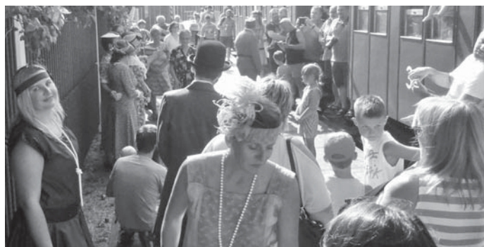
Doba 1. republiky se přenesla na chvíli i do Nové Vsi.

cestou ve vlaku. A krásnou ozdobou byly i Sestry Havelkovy, které pár svých melodií zazpívaly i při zastávce vlaku v Nové Vsi.