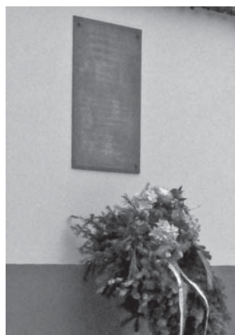
Pamětní deska v Borovnici bývala na zdi domku, ale při děláni nové fasády byla (nově přeleštěná) dána na vedlejší zed.