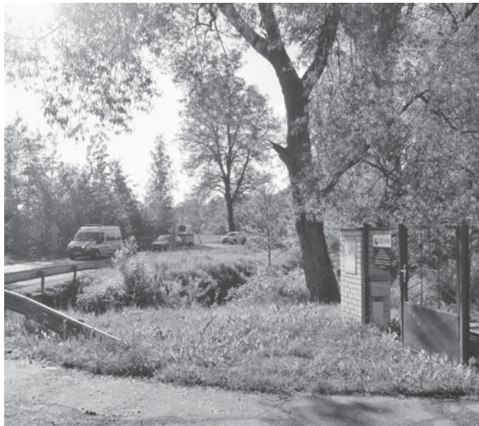
Přečerpávací stanice na konci zástavby směrem na Strážkovice vpravo.

V posledním vydání zpravodaje bylo popsáno, jaký bude předpokládaný postup prací na momentálně nejrozsáhlejší a technicky náročné stavbě v naší obci. Již bylo zmíněno, že stavba byla pozastavena z několika důvodů. Tím prvním důvodem je vyřízení administrativní části stavebního povolení kanalizačních přípojek. Všechny potřebné souhlasy vlastníků pozemků pro uložení těchto odboček se již podařilo shromáždit. Musím zdůraznit, že ne všichni vlastníci nemovitostí v této části obce zde mají trvalý pobyt. Podepsat potřebné formuláře musí opravdu všichni, kterých se stavba dotkne. Velký technický oříšek je napojení pro ty, jimž bude přípojka vedena přes silnici. Vlastníkem této komunikace je Správa a údržba silnic Jihočeského kraje. Jednou z podmínek pro plánované uložení přípojky je řešení napojení ne klasickým výkopem silnice, ale takzvaným podvrtem pod vozovkou. Tato technologie je vzhledem k počtu napojení poměrně drahá a hlavně hrozí poškození již položených sítí, u kterých neznáme přesné zaměření místa a hloubky.