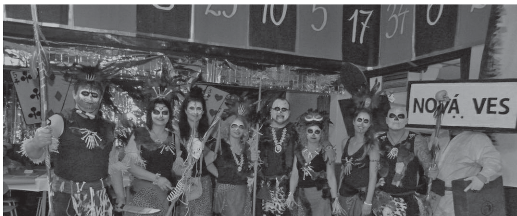
Parta lidojedů pod číselníkem rulety.