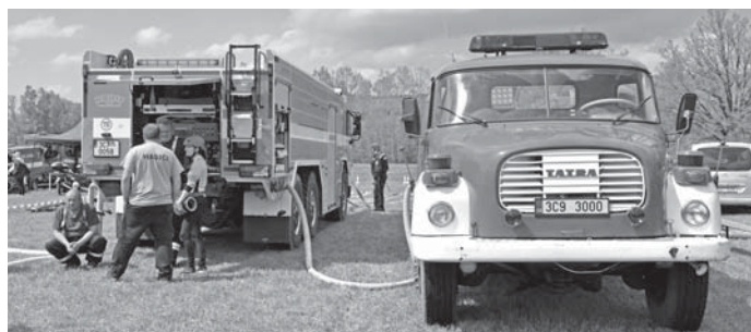
Setkání generací - lednická Tatra T815-7 napájená římovskou T148.