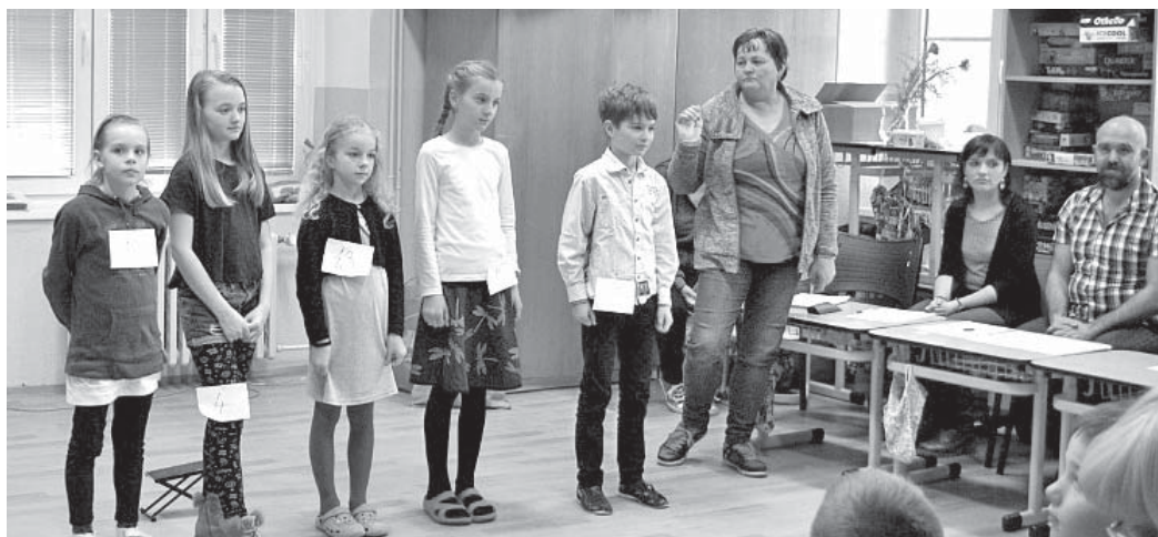
Soutěžící děti ve hře na hudební nástroje.