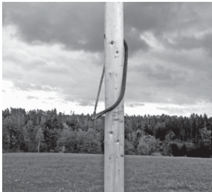
Pila zůstala jako trofej a ozdobila našim májku.

na cestu. Když jsme tam přišli, tak jsme nemohli věřit svým očím, bylo tam ještě asi 20 lidí a naše naděje pohasínaly. Rozhodli jsme se ještě chvíli počkat a vyplatilo se to, lidé pomalu začínali odcházet. Nám ale docházela trpělivost a tak jeden z nás dostal odvahu a pomalu se přiblížil až k májce. Opatrně začal řezat a nikdo si ho nevšiml, tak pokračoval. Když byl asi v jedné třetině, tak si ho všimli a vydali se za ním. Dostihli ho a dali mu co proto. Poté jsme se za vsí sešli, byli jsme celkem vystrašení a vydali se zpět do Nové Vsi. Tam jsme potom hlídali tu naši až do rozednění, aby nám ji nikdo nepodfízl. Lukáš Jankl