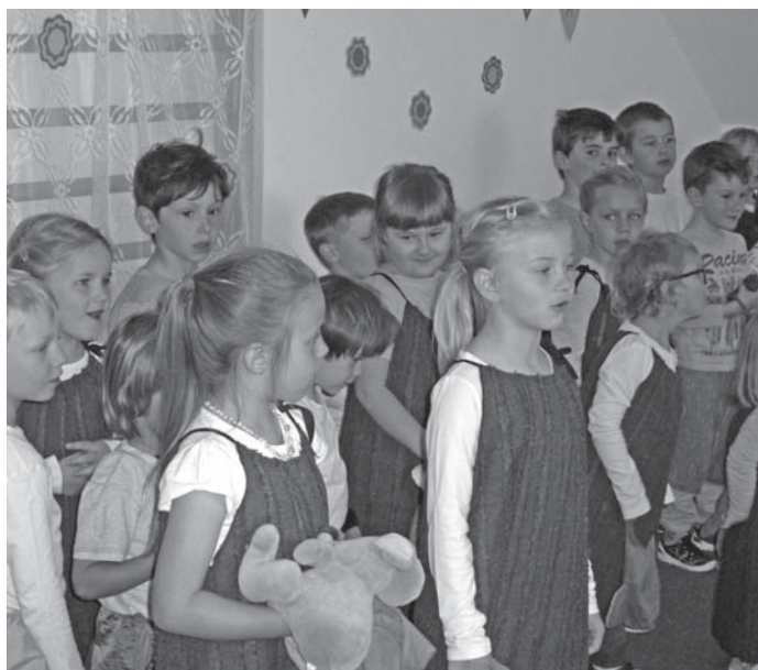
Spokojené děti jsou tou nejlepší vizitkou naší mateřské školy.

právem přijetí, které před začátkem školního roku dosáhnou nejméně třetího roku věku dítěte, a které zároveň splnily kritéria trvalého bydliště, zdravotní způsobilosti a podle data narození jsou nejstarší. (kritérium věk dítěte – upřednostňují se starší děti).