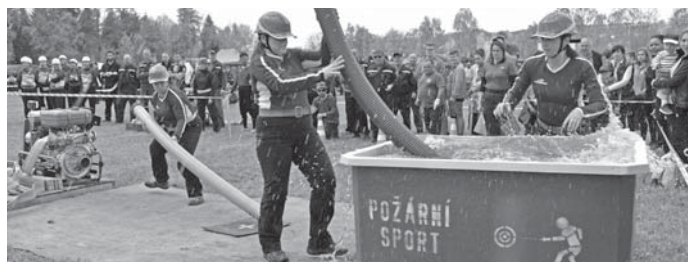
Členky družstva SDH Nová Ves při požárním útoku.