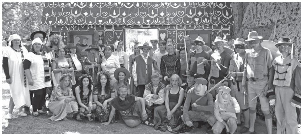
Společná fotografie pořadatelů ukazuje kolik „ochotníků“ se na akci podílí, fotografie není stará více než 5 let.

Zapátrali jsme spolu v nedávné historii a vystopovali témata, kterým se dětské dny věnovaly. V prvním roce 2007 bylo téma „Z pohádky do pohádky“, v roce 2008 byl