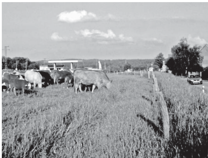
Stádo skotu na pastvě u hlavní silnice vedle benzínové pumpy.

Na pastvinách v okolí Hůrky a Nové Vsi se v současné době pase celkem 168 krav se 146 telaty z kravína Hůrka. Jedná se o masná plemena skotu s největším zastoupením masného simentála, českého strakatého skotu a charolais. Krávy jsou rozděleny do dvou stád. Do konce července jsou ve stádech i 4 plemenní býci plemen masný simentál, aberdeen angus a dva limousine. Krávu od býka rozeznáte dle barvy ušních značek – kráva má známky žluté, býk růžové. Trvale oploceno máme asi 80 ha luk. Pastva probíhá střídáním ploch dle travního porostu. Na každé pastvině se stádo zdrží zhruba 14 dní. Naše krávy i býci