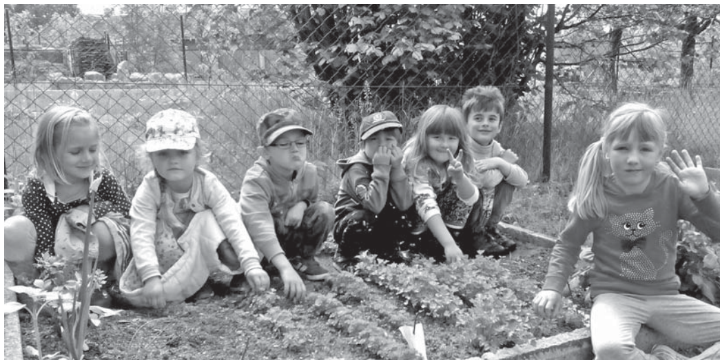
Děti na záhonku pěstují bylinky, které se pak využijí i v naší kuchyni.

Za pomoci pracovníků obecního úřadu a všech zaměstnanců mateřské školy jsme oseli bylinkovou zahrádku a bylinky využíváme do naší kuchyně. Na konci zahrady máme velký záhon na maliny, borůvky a ostružiny, které vysazujeme postupně, vzhledem k vysokým pořizovacím nákladům sazenic. Ještě bychom rádi dodělali květinový záhon, přírodovědný chodník s různými povrchy a domeček pro zvířátka, hlavně ta malá, jako jsou broučci, mravenci atd. Nestihli jsme zorganizovat školní brigádu, ale budeme moc rádi, když by měl někdo chuť nám s velebením školní zahrady