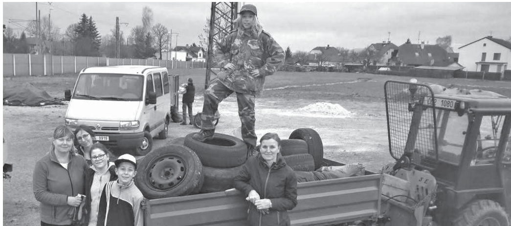
Skupina, která v úseku kolem hlavní silnice na Strážkovice, posbírala přes 10 pytlů odpadu a 11 pneumatik.

Někdy stačí tak jenom trochu postrčit a přiznám se, že tento podnět přišel od rodiny, která v Nové Vsi bydlí pouze krátce. Ke konci března se objevila prosba o uspořádání a připojení k celorepublikové akci Uklidme Česko. Uklidme svět, uklidme Česko, je dobrovolnická úklidová akce, která probíhá na území celé České republiky. Jejím cílem je uklidit nelegálně vzniklé černé skládky a nepořádek. Společně v jeden den. Letos byl tento den stanoven na sobotu 6. dubna. U nás na toto datum probíhal svoz velkoobjemového odpadu, to se akorát hodilo. A tak bylo rozhodnuto připojit se k této akci s jednodenním náskokem v pátek. Po jednoduché registraci na webu organizace nám byly zaslány informace s návodem jak nejlépe postupovat a na co si dát pozor. Účastníci se mohli registrovat na stránkách