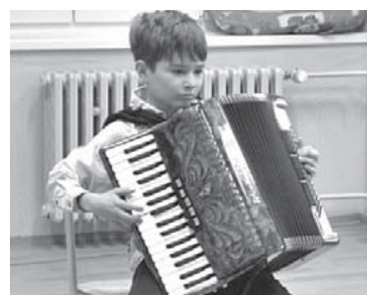
Žák 4. třídy Základní školy Nedabyle soutěžící ve hře na akordeon.