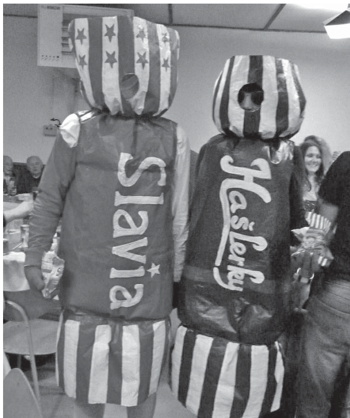
První místo v soutěži masek obsadily Bonbony „Hašlerka“ a „Slavie“.