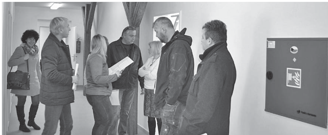
Účastníci závěrečné kontrolní prohlídky v půdní vestavbě ZŠ Nedabyle.

Díky této rekonstrukci vznikly v půdních prostorách nové třídy, nové sociální zařízení a vybavená sborovna pro paní učitelky. A také poprvé v historii obce Nedabyle vznikla jedna potřebná třída mateřské školy pro třináct předškolních dětí. Dne 26. března provedl stavební úřad závěrečnou kontrolní prohlídku tříd v půdních prostorách školy, které září novotou a věříme, že se budou žákům i učitelskému sboru líbit. Na závěr se sluší poděkovat firmě Aubock s.r.o. za kvalitně odvedenou práci, hlavnímu stavbyvedoucímu